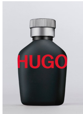
BOSS Just Different EDTS, 40 ml UVP 63,50€ → 19,90€ 11=497,50 €