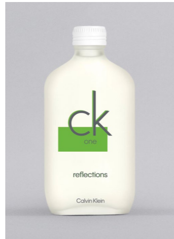
CALVIN KLEIN CK One Reflections EDTS, 100 ml UVP 56,-€ 29,90€ → 27,99€ 11=279,90 €