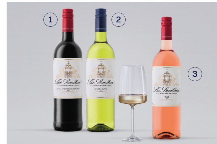
1-3 BOSCHENDAL 1 The Pavillion Shiraz / Cabernet Sauvignon 2 The Pavillion Chenin Blanc 3 The Pavillion Rosé, Südafrika, 0,75l UVP 8,99€ 7,69€ → je 6,99€ 1l = 9,32€