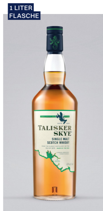
TALISKER Skye Single Malt Whisky, 45,8% Vol., 1l UVP 74,90€ 56,99€ → 47,99€