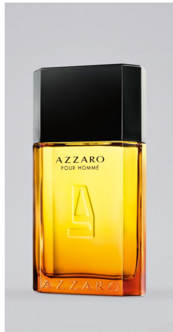
AZZARO Azzaro Pour Homme EDTS, 100 ml UVP 82,-€ 39,90€ → 35,99€ 11=359,90€