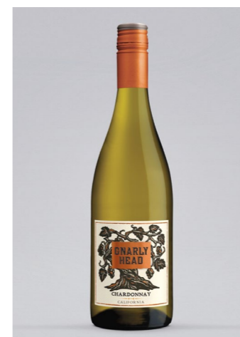
GNARLY HEAD Chardonnay, Kalifornien, 0,75l UVP 13,99€ 12,49€ → 10,99€ 1l = 14,65€