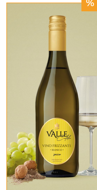
VALLE CALDA Vino Frizzante Secco, Italien, 0,75l 4,99€ → 3,99€ 1l=5,32€