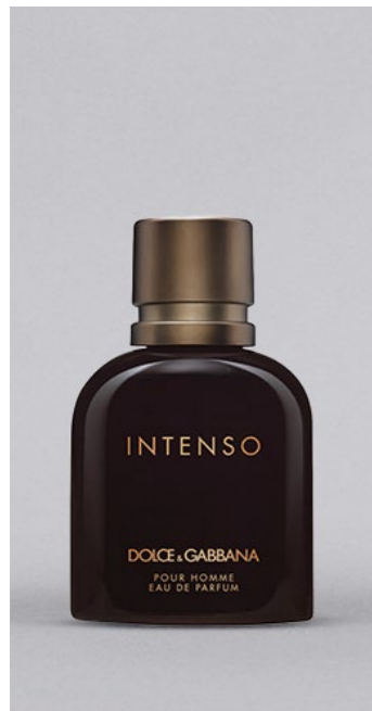
DOLCE & GABBANA Intenso pour Homme EDPS, 75 ml UVP 86,-€ 39,90€ → 35,99€ 11=479,87 €

→ Erstklassige Parfums: Verführerische Düfte für Sie und Ihn