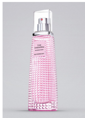
GIVENCHY Live Irresistible Blossom Crush EDTS, 50 ml UVP 82,-€ → 39,90€ 11=798,- €