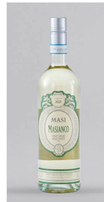
MASI Masiano Pinot Grigio IGP, Italien, 0,75l UVP 11,50€ 9,49€ → 7,99€ 1l=10,65€