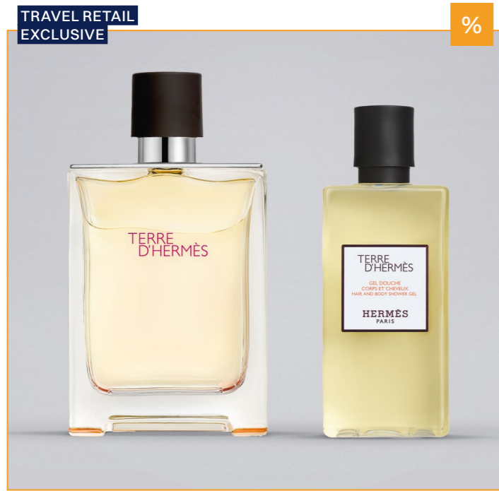
HERMÈS Terre d'Hermès Set: EDTS 100 ml + Duschgel 80 ml UVP 122,-€ 99,99€ → 89,99€

→ Erstklassige Parfums: Verführerische Düfte für Sie und Ihn