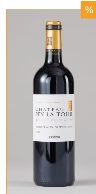
CHATEAU PEY LA TOUR Réserve Bordeaux Supérieur, Frankreich, 0,75l 12,49€ → 9,99€ 1l = 13,32€