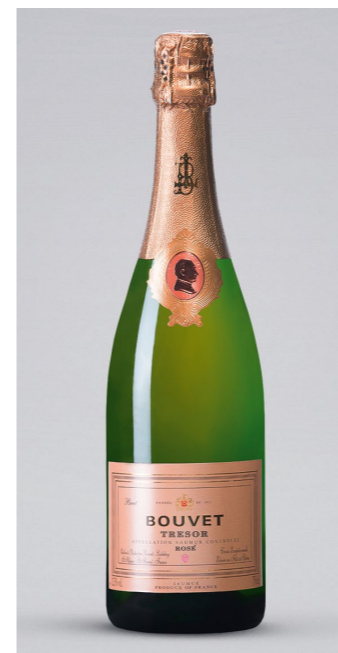
BOUVET LADUBAY Trésor Rosé, Crémant de Loire, Frankreich, 0,75l UVP 17,95€ 15,99€ → 13,99€ 1l=18,65€