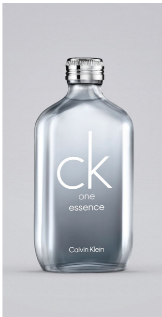
NEU CALVIN KLEIN CK One Essence EDPS, 50 ml UVP 48,-€ → 39,90€ 11=798,- €