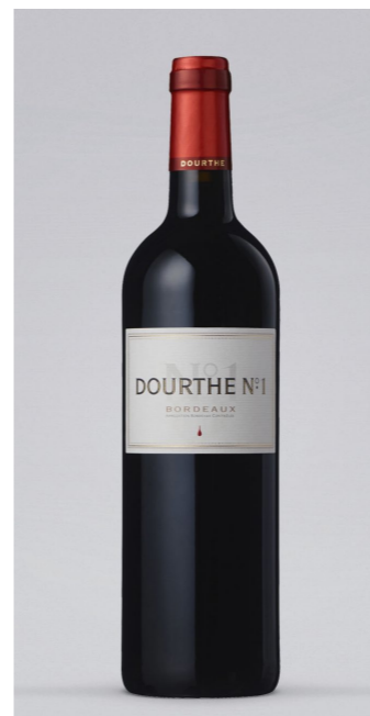
DOURTHE No.1 Bordeaux Rouge, Frankreich, 0,75l 9,99€ → 7,99€ 1l = 10,65€