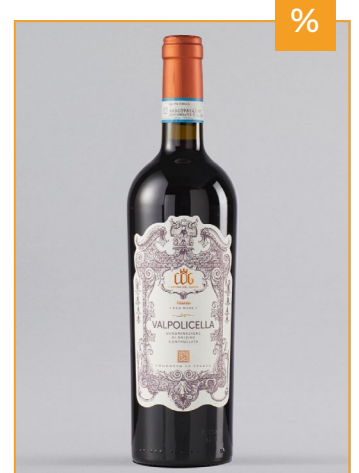
CANTINA DEL GARDA Valpolicella DOC, Italien, 0,75l UVP 8,99€ 6,99€ → 5,99€ 1l=7,99€