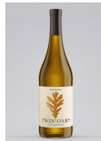
ROBERT MONDAVI Twin Oak Chardonnay, Kalifornien, 0,75l 10,99€ → 9,99€ 1l = 13,32€