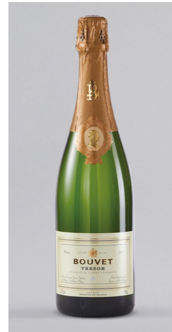
BOUVET LADUBAY Trésor Blanc, Crémant de Loire, Frankreich, 0,75l UVP 17,95€ 15,99€ → 13,99€ 1l=18,65€