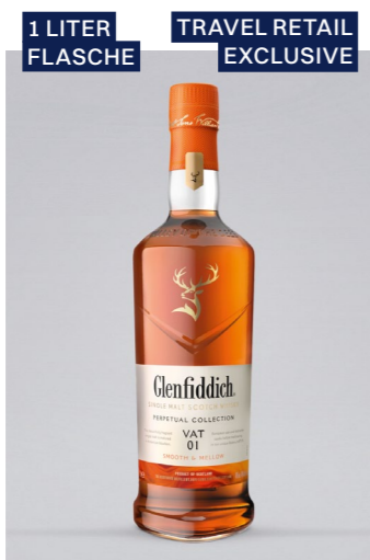
GLENFIDDICH Perpetual Collection VAT 1, Single Malt Scotch Whisky, 40% Vol., 1l UVP 62,90€ 49,99€ → 41,99€