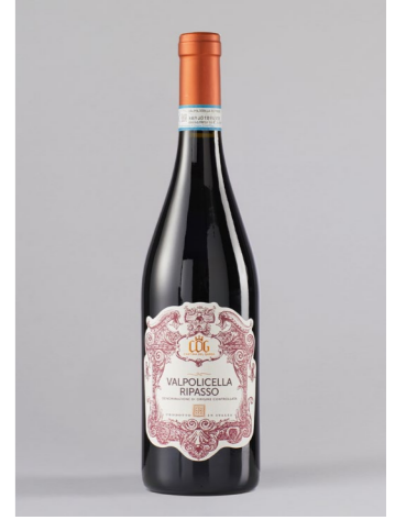
CANTINA DEL GARDA Valpolicella Ripasso DOC, Italien, 0,75l UVP 11,99€ 9,99€ → 8,99€ 1l=11,99€