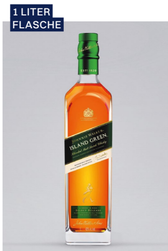
JOHNNIE WALKER Island Green Blended Malt Whisky, 43% Vol., 1l UVP 71,90€ 59,99€ → 54,99€