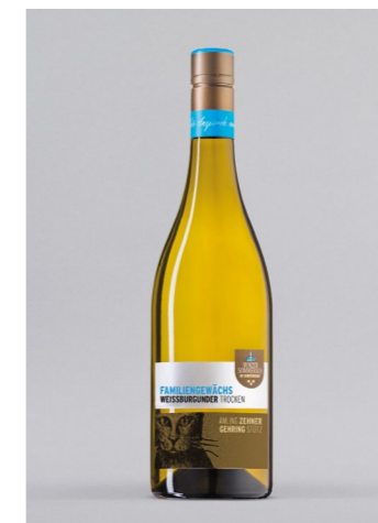
SOMMERACH Weissburgunder Familien-gewächs, Franken, 0,75l UVP 8,-€ 6,99€ → 5,99€ 1l=7,99€