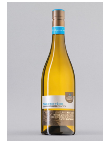
SOMMERACH Grauburgunder Familiengewächs, Franken, 0,75l UVP 8,-€ 6,99€ → 5,99€ 1l=7,99€