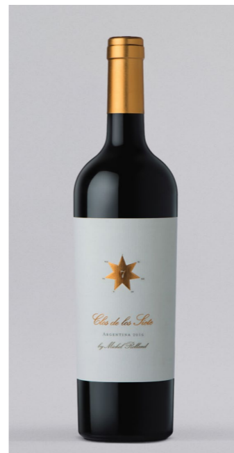
MICHEL ROLLAND Clos de Los Siete, Argentinien, 0,75l 16,99€ → 14,99€ 1l = 19,99€