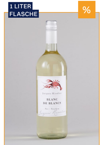
JACQUES RIVOLIER Blanc de Blancs QbA, Pfalz, 1l 4,29€ → 3,79€