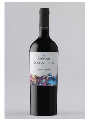
MONT GRAS Quatro, Chile, 0,75l UVP 10,95€ 10,49€ → 8,49€ 1l = 11,32€