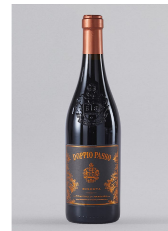
DOPPIO PASSO Riserva Primitivo di Manduria, Italien, 0,75l UVP 11,95€ 11,49€ → 8,99€ 1l=11,99€