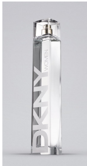
DONNA KARAN DKNY Women EDTS, 100 ml UVP 95,-€ 39,90€ → 35,99€ 11=359,90€