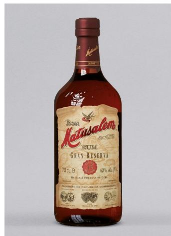
MATUSALEM Gran Reserva Rum 15y, 40% Vol., 0,7l UVP 29,90€ 24,99€ → 19,99€ 1l = 28,56€