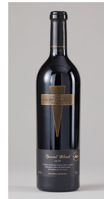
BODEGA FIN DEL MUNDO Special Blend, Argentinien, 0,75l UVP 34,99€ 32,99€ → 29,99€ 1l = 39,99€

→ Eine Vielfalt an Spirituosen finden Sie auch in unserem Onlineshop: WWW.RINGELTAUBE.DE/SHOP