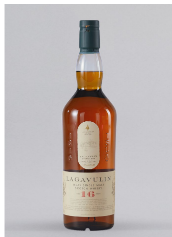
LAGAVULIN Single Malt Whisky 16y, 43% Vol., 0,7l UVP 85,90€ 79,99€ → 69,99€ 1l = 99,99€