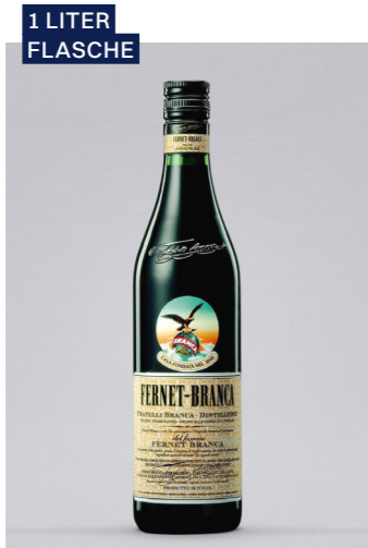
FERNET-BRANCA Bitter, 39% Vol., 1l UVP 23,50€ 21,49€ → 17,99€