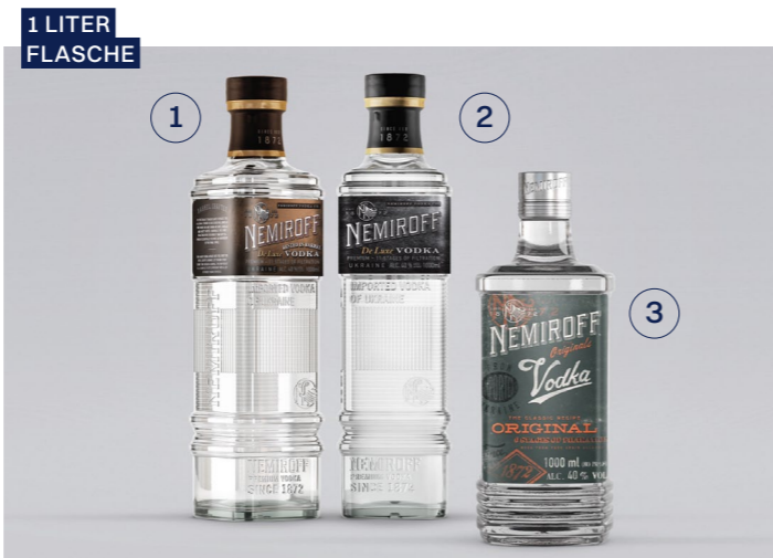
1-3 NEMIROFF 1 De Luxe Rested in Barrel Vodka, 40% Vol., 1l 16,99€ → je 13,99€ 2 De Luxe Vodka, 40% Vol., 1l 16,99€ → je 13,99€ 3 Vodka Original, 40% Vol., 1l 15,99€ → 12,99€