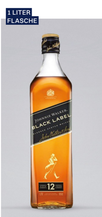
JOHNNIE WALKER Whisky Black Label 12y, 40% Vol., 1l UVP 48,90€ 38,99€ → 32,99€