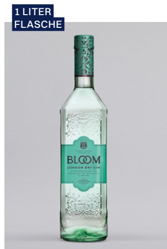
BLOOM London Dry Gin, 40% Vol., 1l UVP 31,90€ 26,99€ → 22,99€